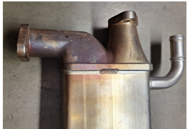
Blasen- und Rissbildung (links) und deutliche Verfärbungen (rechts) – typische Schadensbilder bei thermischer Überlastung

Motorservice erreichen immer wieder AGR-Kühler, die kurz nach dem Einbau thermische Schäden aufweisen. Diese Schäden sind direkt oder indirekt auf eine thermische Überbelastung zurückzuführen.