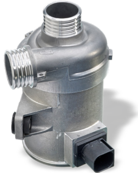
CWA400 – beispielhafte Wasserpumpe

Nach dem Einbau des neuen AGR-Kühlers muss sichergestellt werden, dass der Kühlmittelkreislauf nach Herstellervorgaben entlüftet wird. Dadurch werden Luftblasen, sogenannte Hotspots, vermieden.